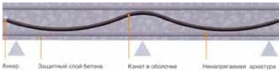
Рисунок 1. Принципиальная схема раскладки канатов в конструкции

раскладка, при которой фиксируются только анкерные элементы, и фиксированная раскладка, с фиксированием каната на подкладках. При свободной раскладке геометрия каната определяется его жесткостными характеристиками, собственным весом и габаритами конструкции.